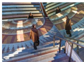
Jure Kravanja - Celje