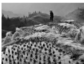
Branislav Brkić - Srbija

Razstava v galeriji Kranjske hiše bo odprta vsak dan med 6. in 31. januarjem od 8. do 19. ure, ob nedeljah in praznikih od 9. do 18. ure.